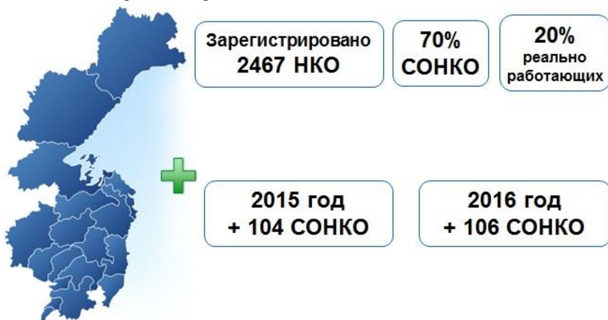
Рисунок 1. Численность социально ориентированных некоммерческих организаций в Хабаровском крае

Поддержка СОНКО в крае осуществляется на муниципальном уровне и краевом: в рамках программ отраслевых министерств и программы "Содей-