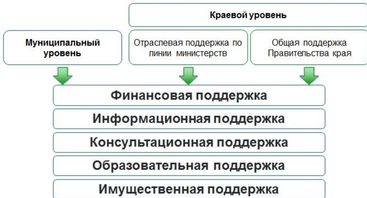
Рисунок 2. Структура системы поддержки социально ориентированных некоммерческих организаций Хабаровского края

Основная цель программных мероприятий по поддержке СОНКО – создание и поддержание условий для формирования устойчивой и профессиональной деятельности некоммерческих организаций по решению задач социально-экономического развития края.