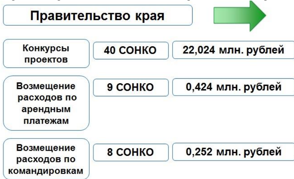
Рисунок 4. Механизмы финансовой поддержки социально ориентированных некоммерческих организаций, оказываемой Правительством края

В 2016 г. министерством социальной защиты населения края осуществлялась поддержка СОНКО, включенных в реестр поставщиков социальных услуг в соответствии с постановлением Правительства края от 29 декабря 2015 г. № 480-пр "Об утверждении Порядка определения размера и выплаты компенсации поставщикам социальных услуг, включенным в реестр поставщиков социальных услуг Хабаровского края, но не участвующим в выполнении государственного задания (заказа), при получении у них гражданином социальных услуг, предусмотренных индивидуальной программой предоставления социальных услуг".